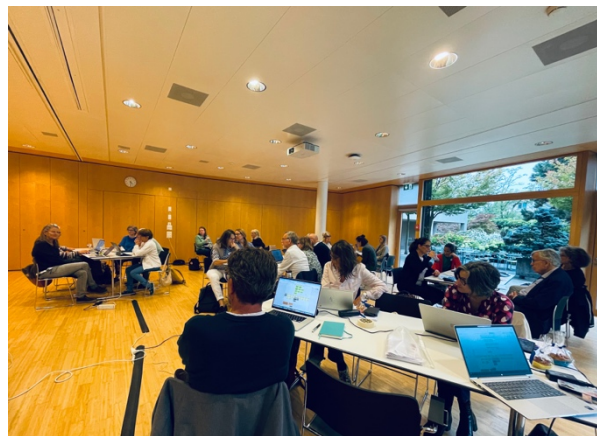
Mit neuen Methoden gemeinsam Ideen entwickeln

Im interaktiven Workshop entwickelten die Teilnehmenden Handlungsfelder für einen Kanton Zürich, in dem Menschen mit Demenz und ihre Angehörigen gut unterstützt werden und Teil der Gesellschaft sind. Dabei probierten sie neue Methoden aus, die sie auch in ihrem eigenen Arbeitsumfeld einsetzen können. So arbeiteten sie zum Beispiel in sogenannten «Get-it-done-Sessions». Diese Arbeitsweise ist darauf ausgerichtet, rasch konkrete Ergebnisse zu erzielen, anstatt sich vor allem auf Diskussion und Koordination zu konzentrieren. Gemeinsam identifizierten sie drei Themen, die nach der Veranstaltung in Gruppen weiterverfolgt wurden: Niederschwellige Kontaktmöglichkeiten für Betroffene, vielfältige und zeitgemässe Tagesstrukturen sowie die Entlastung von Angehörigen.