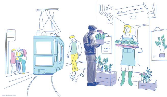
Illustration «Demenzfreundliches Quartier» (Rahel Oertli)

Indem wir gezielt Gelegenheiten für Begegnung und Austausch schufen und dabei innovative Formate erprobten, kamen die Beteiligten ins gemeinsame Handeln. Dabei knüpften sie Kontakte, entdeckten gemeinsame Interessen und teilten Erfahrungen. Es waren die ersten Schritte hin zu einer «Community», die sich für einen demenzfreundlichen Kanton Zürich einsetzen will.