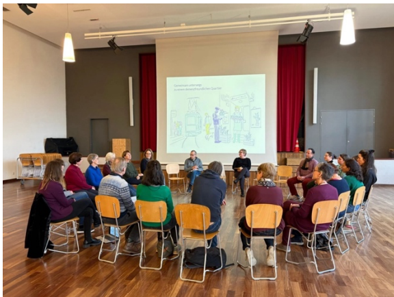
Kennenlernen am ersten Netzwerktreffen

Das Projekt hat zum Ziel, dass Menschen mit Demenz und ihre Angehörigen sich im Quartier gut aufgehoben und unterstützt fühlen und möglichst lange am sozialen Leben teilhaben können. Kernstück ist ein Netzwerk mit interessierten Personen aus dem Quartier, wie zum Beispiel Vertreter:innen von Demenz- und Altersorganisationen, Kirchgemeinden, Firmen, Vereinen, aber auch Quartierbewohnende. Betroffene und Angehörige werden selbstverständlich in das Projekt miteinbezogen, und auch Vertretende der Stadt Zürich wirken mit, um den Austausch mit dem städtischen Demenzprojekt sicherzustellen und Synergien nutzen zu können. Beteiligte des Netzwerks können Massnahmen zur Sensibilisierung sowie zur Förderung von Begegnung, Beteiligung und Vernetzung entwickeln. So sind zum Beispiel Schulungen für Mitarbeitende mit Kundenkontakt oder Vereinsmitglieder denkbar, um Kontakte und Begegnungen mit Betroffenen zu erleichtern. Neben neuen Initiativen ist es jedoch besonders wichtig, bestehende Informationen und Angebote stärker zu verbreiten und bekannter zu machen.