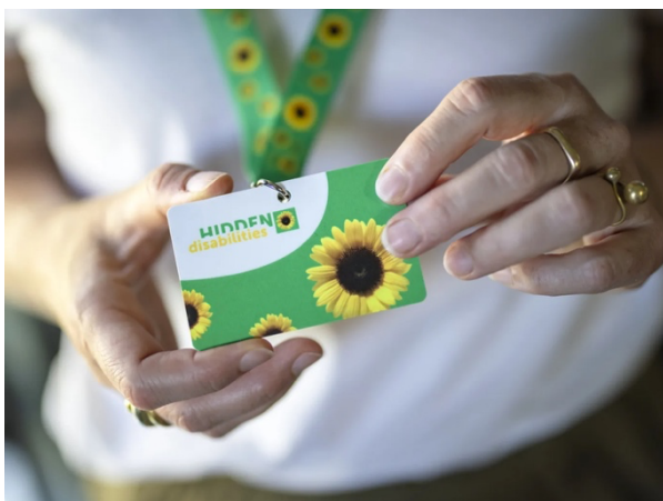
Sunflower Lanyard zur Unterstützung von Reisenden

Reisen im öffentlichen Verkehr kann für Menschen mit Demenz mit grossem Stress verbunden sein, zumal die Erkrankung meist nicht auf den ersten Blick erkennbar ist. Um auf unsichtbare Einschränkungen aufmerksam zu machen, führte die SBB gemeinsam mit der Plattform Mäander und