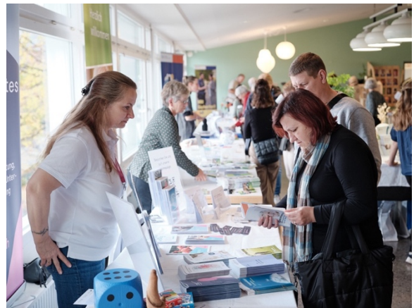
Marktstände mit Informationen und Angeboten